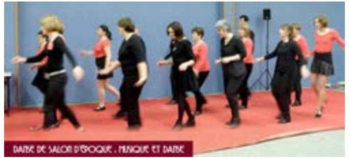
DANSE DE SALON D'EPOQUE, MUSIQUE ET DANSE