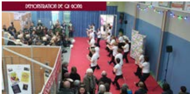
DEMONSTRATION DE GI BONS