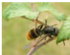
Frelon asiatique (30 à 40 mm)

Son aiguillon ou dard n'est pas plus long que celui du frelon européen et il émet la même quantité de venin. Son vol étant plus rapide, il transperce les différentes couches de tissus plus facilement. À ce titre, il peut être considéré comme plus dangereux.