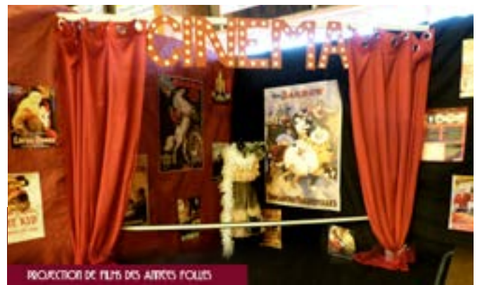
PROJECTION DE FILMS DES AUTRES FOLIES