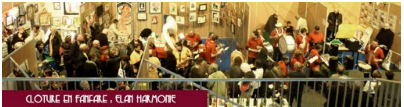
CLOTURE EN FANFARE, ELAN HARMONIE