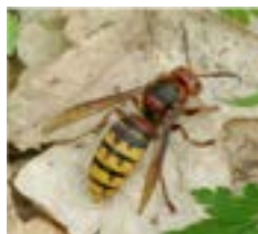
Frelon européen (50 à 60 mm)