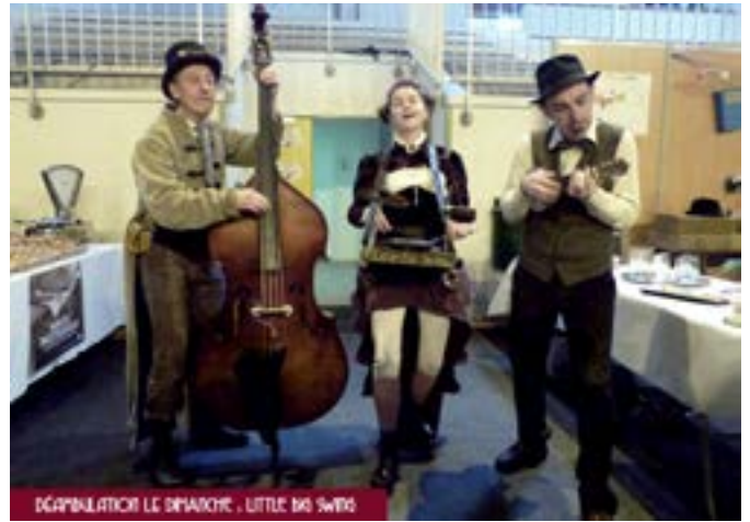
DEGAMBULATION LE BRANCHÉ, LITTLE BIG SWISS