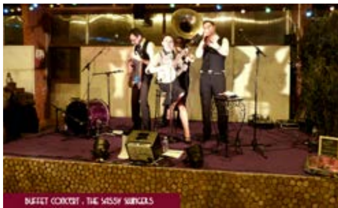
BUFFET CONCERT, THE SASSY SWINGERS