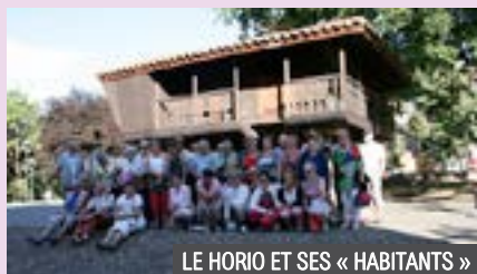
LE HORIO ET SES « HABITANTS »

En octobre nous avons ouvert la saison d'hiver : « belote ». Nos habitués ont répondu présent, de nouvelles équipes ont participé à la bonne humeur ambiante. Merci à tous et rendez-vous le 9 décembre.