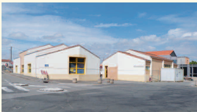
Les ateliers municipaux du centre bourg seront transférés dans la zone de la Nivardière

Afin de pouvoir répondre à l'ensemble des besoins des services techniques, la commune a acquis en 2011 un terrain et un bâtiment situé à la Nivardière et permettant de regrouper tous les agents sur un site unique.