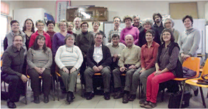
Les Martin Chanteurs répètent tous les lundis, salle Détente et Harmonie

La chorale des Martin Chanteurs, associée au chœur « Voc-tambules » d'Orvault se produira en janvier pour deux concerts de Noël, associant chants Gospel, Renaissance et orthodoxe russe.