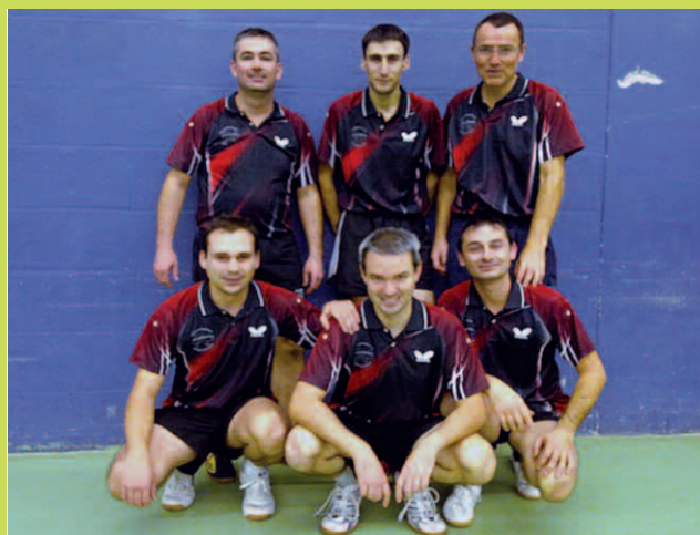
L'équipe première ayant évolué en pré nationale en première phase (de gauche à droite)

Nous remercions et adressons nos meilleurs vœux à nos sponsors, à nos supporters ainsi qu'aux familles des joueurs qui contribuent à la réussite du Tennis de Table à Pont Saint Martin.