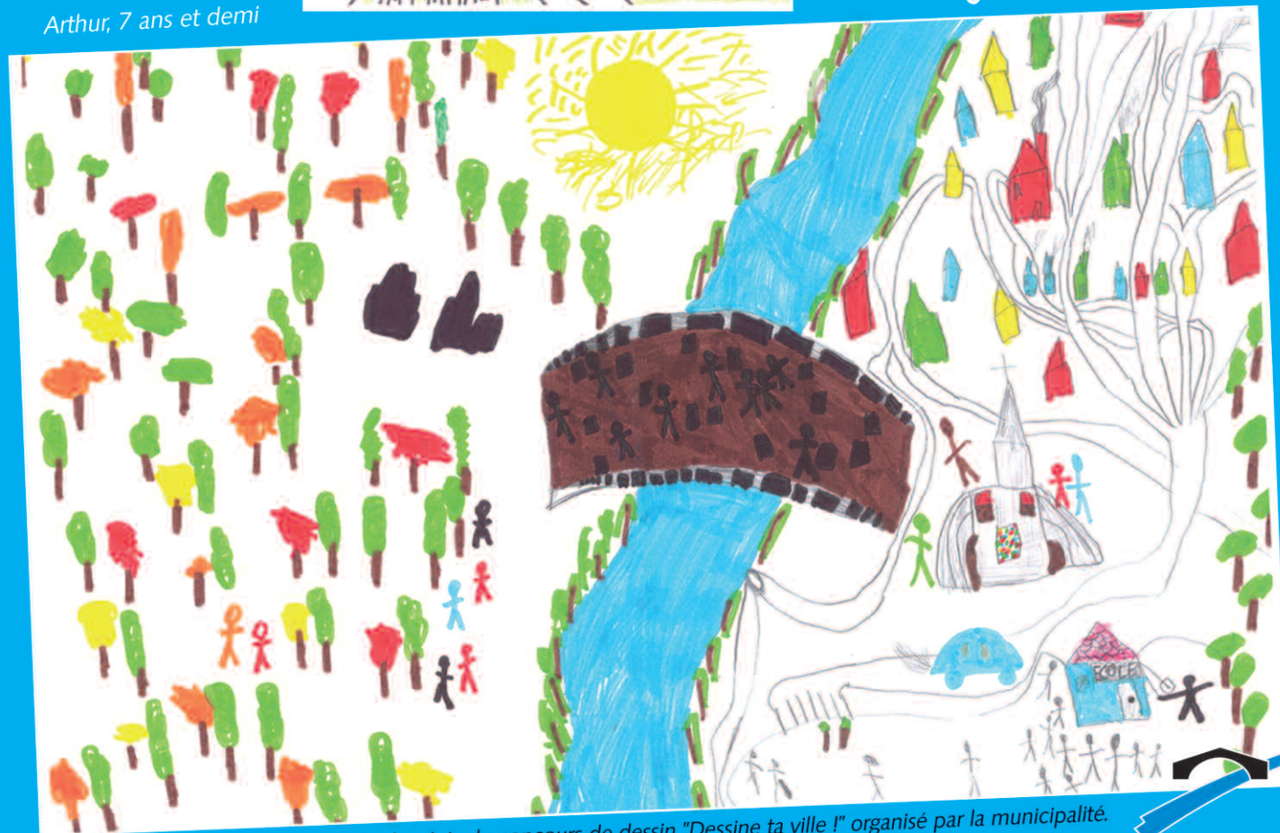
Les trois dessins des lauréats du concours de dessin "Dessine ta ville !" organisé par la municipalité.