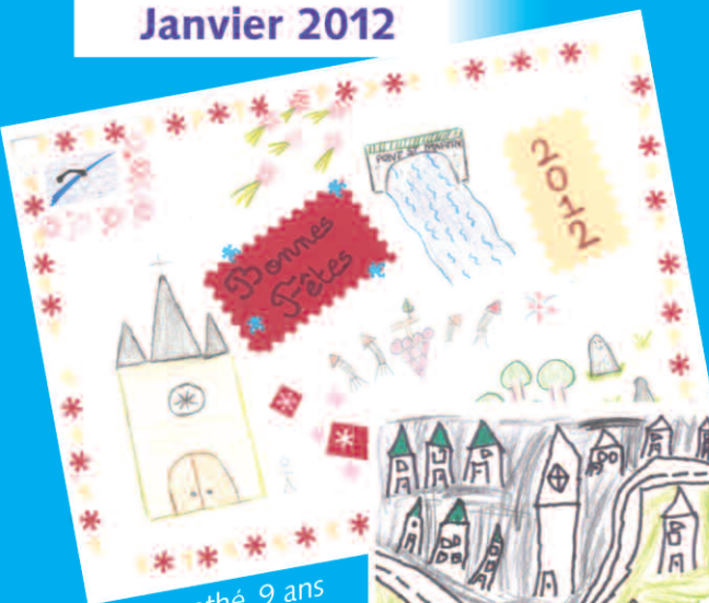
Timothé, 9 ans

Comment sont calculés les impôts locaux ?