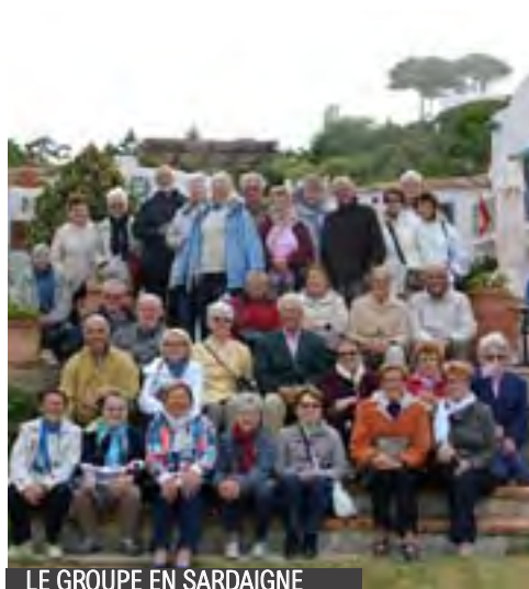
LE GROUPE EN SARDAIGNE

En mai fais ce qu'il te plaît, d'après le dicton. Aussi pour notre sortie surprise du 17 mai, nous avons souhaité très fort un changement de temps. La « surprise » s'éclaircissait au fur et à mesure que nous traversions la Vendée et la Charente Maritime. L'île d'Oléron nous a accueillis avec plus de ciel bleu que de nuages et les maisons de bois peintes « huitrières » avaient fière allure sous le soleil.