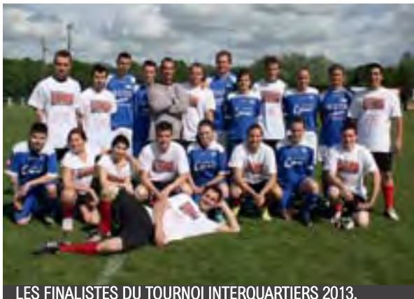
LES FINALISTES DU TOURNOI INTERQUARTIERS 2013.

l'équipe La Rue des Barres. À l'issue du tournoi, les nombreux spectateurs ont pu assister à une rencontre exhibition entre les anciens joueurs de Pont Saint Martin et une sélection régionale. À la mi-temps de ce match, s'est déroulé le tirage au sort de la tombola où de nombreux maillots de football de joueurs professionnels ont été gagnés. Cette tombola a permis de faire un don de 1500 € au profit de l'association « Les Petits Princes ».