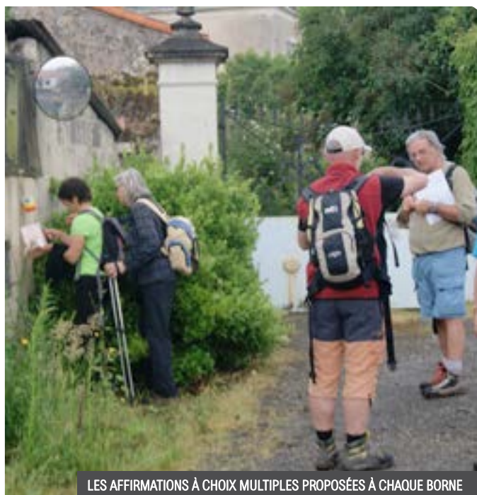
LES AFFIRMATIONS À CHOIX MULTIPLES PROPOSÉES À CHAQUE BORNE