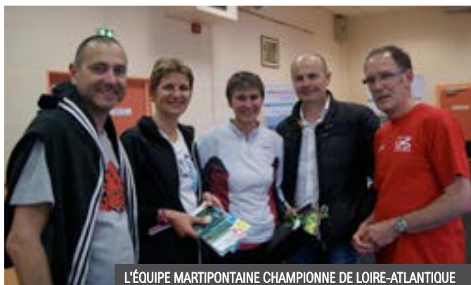
L'ÉQUIPE MARTIPONTAINE CHAMPIONNE DE LOIRE-ATLANTIQUE