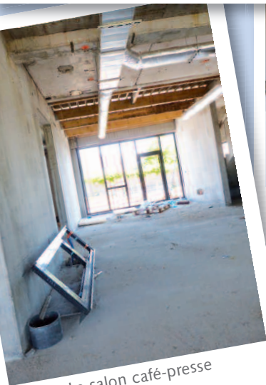
Le salon café-pressé