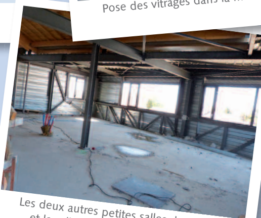
Les deux autres petites salles de réunion et la salle de recherches historiques