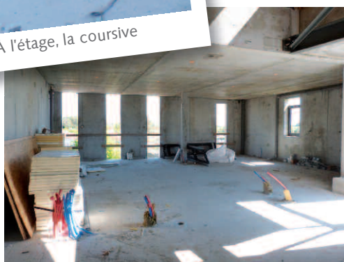
Le studio et les laboratoires numérique et argentique