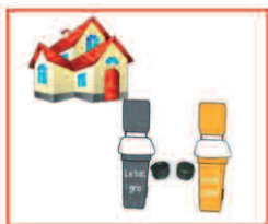
SCHÉMA du CIRCUIT des INFORMATIONS concernant vos bacs jaunes et vos bacs gris

Les bacs individuels sont équipés d'une puce électronique qui contient l'adresse de l'immeuble et le nom de son propriétaire