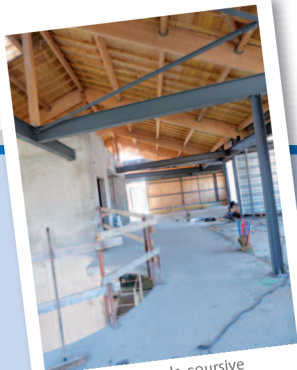
À l'étage, la coursive