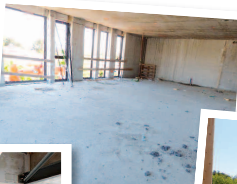
L'atelier, salle dédiée aux arts