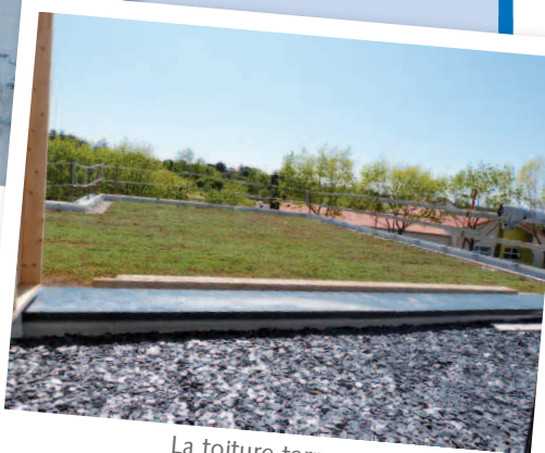
La toiture terrasse