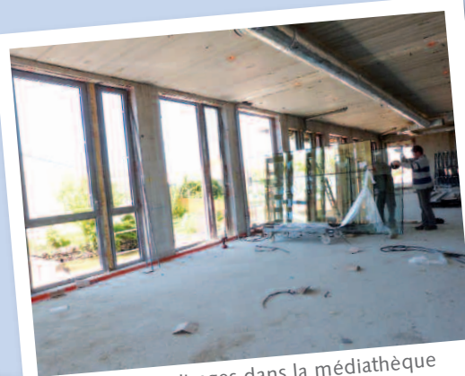
Pose des vitrages dans la médiathèque