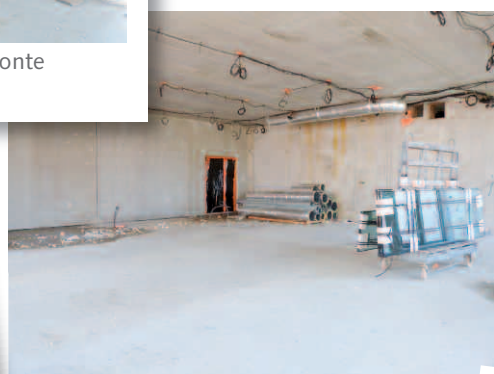
La grande salle de musique

Vos élus souhaitent fortement que Le 3 e Lieu soit pour les Martipontains un lieu « facilitateur social » où l'on s'y rend spontanément avec la certitude de se retrouver en bonne compagnie, entouré d'habités : prendre un café, lire les journaux, flâner devant une exposition, participer aux activités proposées par la médiathèque, se rendre à son activité culturelle, croiser d'autres adhérents, autant d'occasions qui permettront de faire de ce nouvel équipement un espace de convivialité, de découverte, d'apprentissage, de loisirs, de rencontre de l'autre et d'épanouissement personnel.