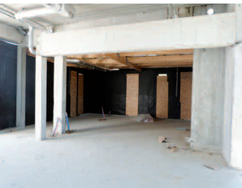
Le futur espace heure du conte

Le troisième lieu est une notion forgée au début des années 1980 par Ray Oldenburg, professeur émérite de sociologie urbaine à l'université de Pensacola en Floride. Il se distingue du premier lieu, sphère du foyer et du deuxième lieu, domaine du travail. Il s'entend comme volet complémentaire, dédié à la vie sociale de la communauté, et se rapporte à des espaces où les individus peuvent se rencontrer, se réunir et échanger de façon informelle.