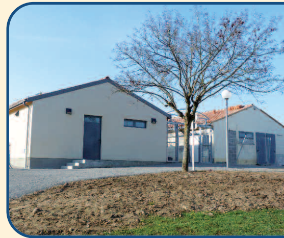
Doublement des vestiaires sportifs

Yves François : La démarche est beaucoup plus complexe qu'il y a quelques années. Le changement de SCOT modifie encore les premières orientations. La loi Solidarité et Renouvellement Urbain impose des obligations de densification, un pourcentage de logements sociaux, etc. Les Grenelle 1 et 2 imposent des modifications dans les règlements et les orientations. Les choix des élus respecteront au mieux les zones humides, la qualité des terres agricoles, les zonages viticoles. Les discussions sont en cours avec le SDAOC* et l'INAO** et leur positionnement très attendu sur les orientations communales, les enjeux étant nombreux dans notre commune de par sa situation géographique. Outre le diagnostic communal et le plan d'aménagement et de développement durable présentés lors de réunions publiques, de nombreuses études sont achevées : l'inventaire des haies et des zones humides, comme le diagnostic agricole, ont été menés avec les exploitants agricoles. Le devenir du secteur de la D2A est en discussion entre la