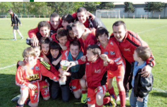
Équipe U13 de PSM vainqueur du tournoi du 1 er mai