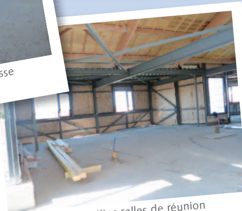
Deux petites salles de réunion