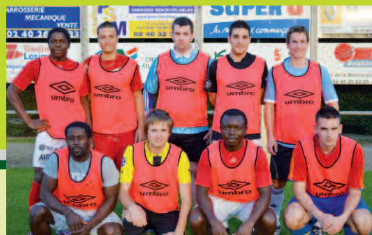
Recrues du groupe seniors saison 2012-2013