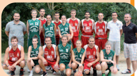
Seniors 1 masculins et féminins