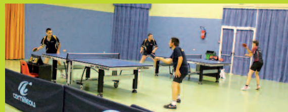
Match amical contre Saint Colmban le 31 août