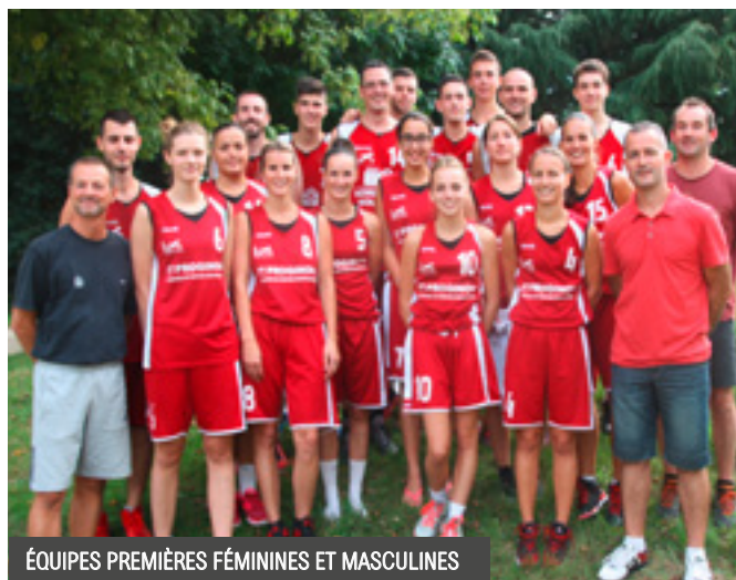
ÉQUIPES PREMIÈRES FÉMININES ET MASCULINES

Dominique Godard – 44 rue du Pays de Retz – 02 40 32 73 43 (après 19h) – godarddominique@wanadoo.fr http://club.quomodo.com/pontsaintmartinbasket