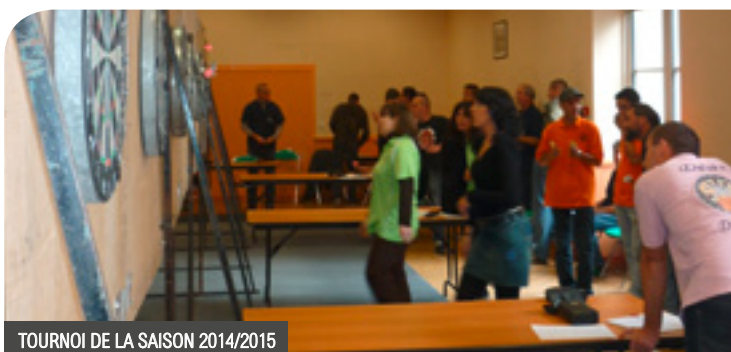
TOURNOI DE LA SAISON 2014/2015