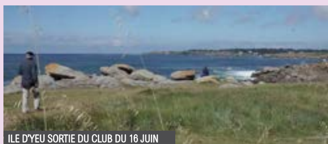
ILE D'YEU SORTIE DU CLUB DU 16 JUIN

Pour notre plus grand plaisir six adolescents ont participé à cette journée. Les attractions et le menu festif ont régalé petits et grands. Une ambiance gaie, détendue a permis à tous de passer une agréable journée.