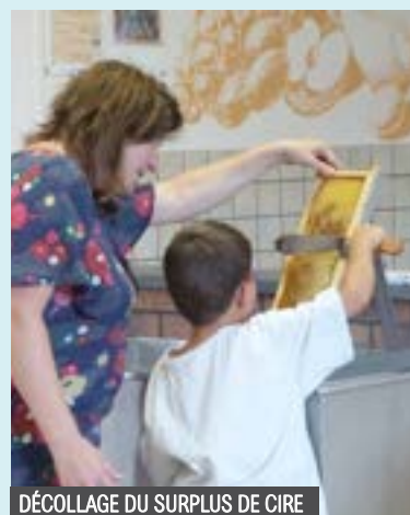
DÉCOLLAGE DU SURPLUS DE CIRE

sur les cadres de bois afin de pouvoir libérer le miel. Ces cadres ont ensuite été disposés dans une centrifugeuse qui, avec la vitesse, a permis d'écouler le miel dans un seau. Ce seau a ensuite été versé dans le maturateur, où le miel restera pendant quelques jours afin d'être filtré avant d'être versé dans les pots. Pour terminer cette découverte, les enfants ont pu goûter au miel : il a fait l'unanimité !