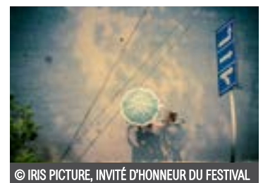
© IRIS PICTURE, INVITÉ D'HONNEUR DU FESTIVAL

Patrick Bouré Président du Photo Club 02 40 32 79 38 06 81 88 22 79 patboure@wanadoo.fr