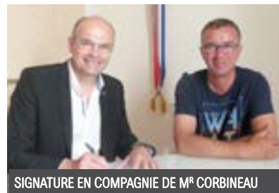
SIGNATURE EN COMPAGNIE DE M R CORBINEAU

Bonne promenade à tous et un grand merci à nos propriétaires, agriculteurs, viticulteurs !