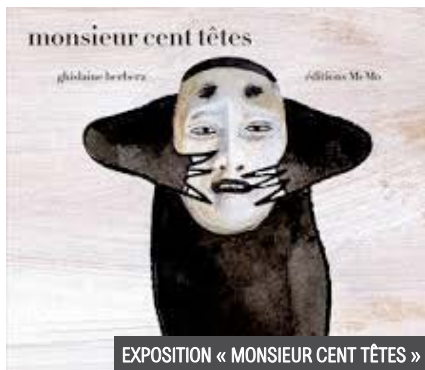
EXPOSITION « MONSIEUR CENT TÊTES »