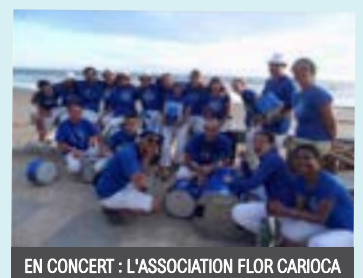
EN CONCERT : L'ASSOCIATION FLOR CARIOCA

Tout l'après-midi, le travail réalisé par les enfants lors des activités périscolaires proposés par le Maison de l'Enfance sera présenté en exposition : réalisation de masques des tribus traditionnelles et mise en couleurs de deux grandes fresques mayas collaboratives .