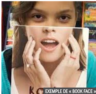
EXEMPLE DE « BOOK FACE »

Samedi 1 er octobre de 10h30 à 11h Pour les enfants de 0 à 3 ans, Boîte à Lectures de la médiathèque. Inscription obligatoire au 02 40 32 79 27