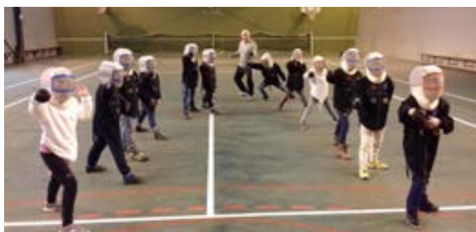
DÉCOUVERTE D'UNE NOUVELLE ACTIVITÉ : L'ESCRIME

Pour des raisons de responsabilité et d'organisation, pensez à vous adresser directement en mairie au 02 40 26 80 23 ou par mail à formalitesfamilles@mairie-pontsaintmartin.fr pour prévenir d'une modification de l'inscription de vos enfants aux TAP selon les mêmes modalités que pour la restauration scolaire (cf règlement intérieur).