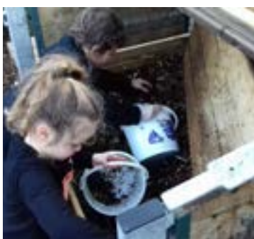
LES JOIES DU COMPOST