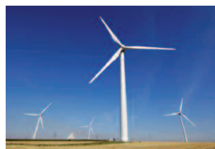
SCHÉMA RÉGIONAL ÉOLIEN

Le schéma Régional Éolien (SRE) doit permettre de favoriser le développement de l'énergie éolienne terrestre et identifie pour cela des zones favorables au développement de cette énergie.