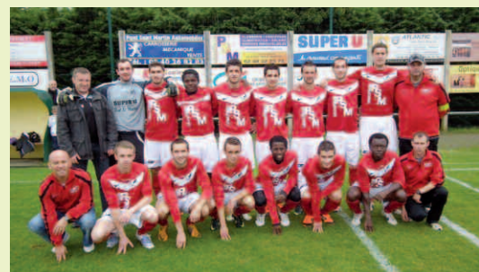
Seniors A – saison 2012-2013 Promotion d'honneur Régionale

N'oubliez pas le concours de belote le dimanche 27 janvier 2013, 14h, salle des fêtes.