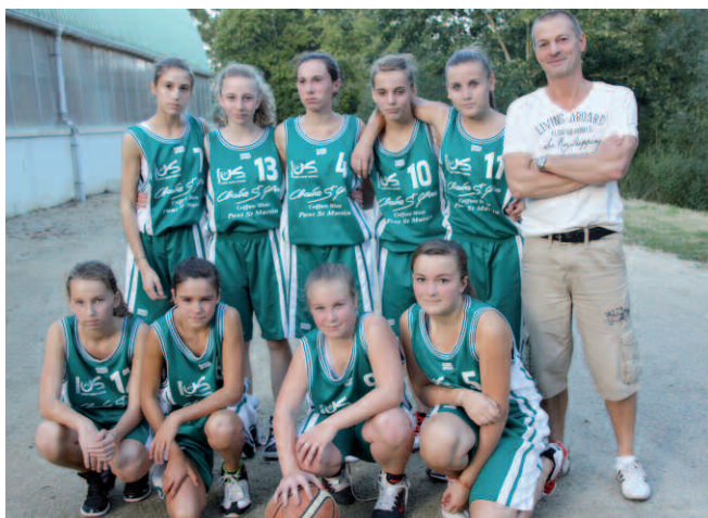
Minimes 1 filles