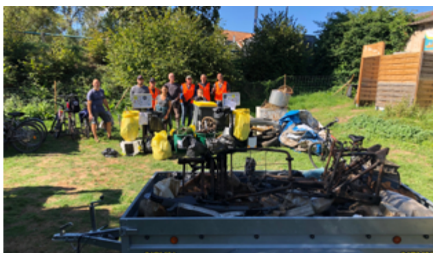
L'an passé, 500 kilos de déchets ont été collectés par un groupe de Martipontain-es motivé-es.

Rendez-vous est donné le samedi 16 septembre à 9h30 à la Halte nature pour récupérer le matériel nécessaire (sacs, gants, chasubles de sécurité...). Les modalités de dépôt des déchets collectés vous seront précisées lors de ce temps d'accueil. Des groupes de participant-es seront formés par quartier/village.