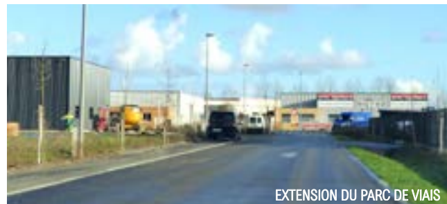
EXTENSION DU PARC DE VIAIS

« Le démarrage des travaux de l'échangeur de Viais, préalable à la continuité de la 2x2 voies Nantes-Challans, constitue le levier attendu venant favoriser l'implantation de nouvelles entreprises sur notre territoire » souligne le maire, Yannick Fétiveau. « En effet, de meilleures facilités d'accès rapprocheront encore plus le parc d'activités de Viais (600 emplois) de l'A83, du Nord Vendée et du périphérique. »