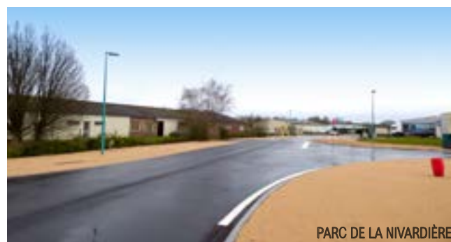
PARC DE LA NIVARDIÈRE

Dans le même temps, le parc d'activités de la Nivardière a fait « peau neuve » afin de permettre aux entreprises d'afficher auprès de leurs clients une image plus agréable et plus moderne. La restauration de l'éclairage public et de la chaussée permet à cette zone de proximité de rester attractive pour l'implantation de nouvelles entreprises ou artisans locaux. L'arrivée imminente de la fibre sur ces deux parcs est un nouvel atout.