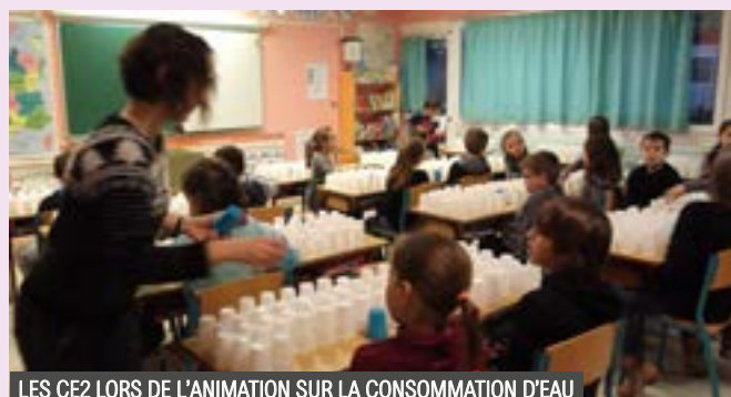
LES CE2 LORS DE L'ANIMATION SUR LA CONSOMMATION D'EAU

Un grand projet d'éducation à l'environnement en lien avec le CPIE de Logne et Grand lieu a été mis en place cette année à l'école élémentaire. Chaque classe bénéficiera de 2 interventions de 3h avec un animateur. Les thèmes abordés concernent l'eau, sa gestion et sa consommation, la faune aquatique, les plantes... Les animations peuvent se dérouler en classe ou dans le cadre privilégié des Prés Moreau, et ce tout au long de l'année.