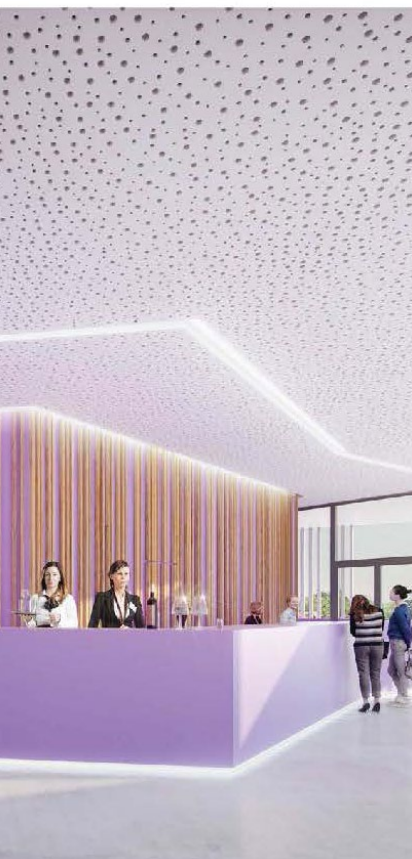
Simulation 3D intérieur, hall

En juin 2017, le jury de concours s'est prononcé en faveur du projet du cabinet Archi Urba Déco. Depuis, de nombreuses réunions ont eu lieu en lien avec le maître d'œuvre et le cabinet de programmation Premier Acte pour affiner le projet et élaborer tous les documents nécessaires à la consultation des entreprises. Une procédure de consultation adaptée a été organisée pour ce marché de travaux, constitué de 25 lots. Après analyse et négociation, ils ont tous été signés au cours de l'été. Après attribution, les premières réunions de chantier ont eu lieu en août.