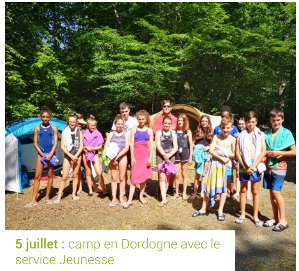
5 juillet : camp en Dordogne avec le service Jeunesse