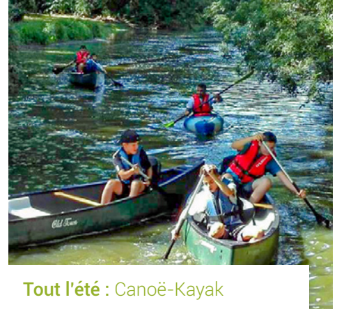
Tout l'été : Canoë-Kayak