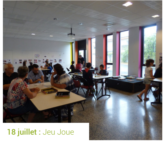
18 juillet : Jeu Joue