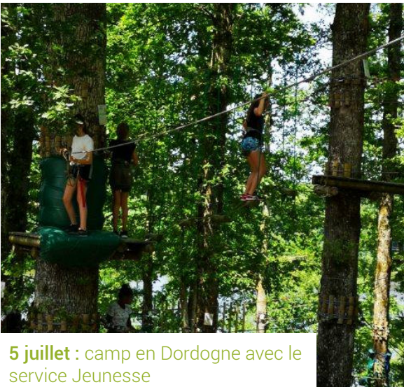
5 juillet : camp en Dordogne avec le service Jeunesse