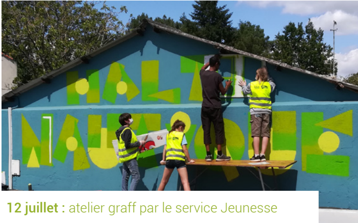
12 juillet : atelier graff par le service Jeunesse