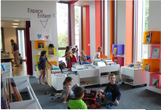
18 juillet : Jeu Joue