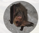
Le Murin de d'Alcathoe