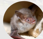
Murin de Bechstein