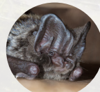
La Bastelle d'Europe

Pour rappel, les espèces de chauves-souris sont toutes strictement protégées, insectivores et inoffensives. L'Observatoire National de la Biodiversité estime que les effectifs ont subi une baisse de près de 38% entre 2006 et 2016.