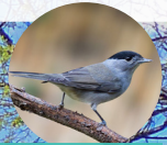
Fauvette à tête noire