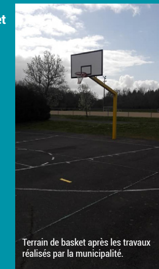
Terrain de basket après les travaux réalisés par la municipalité.

+ d'infos : Tous les renseignements pour les inscriptions sont disponibles sur notre site internet : http://club.quomodo.com/pontsaintmartinbasket .