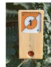
Balise à trouver