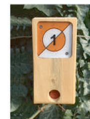
Balise à trouver