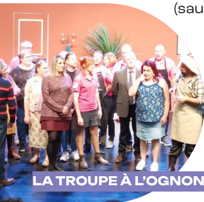
LA TROUPE À L'OGNON

17, 18, 19, 21, 24, 25, 26 et 28 novembre à 20h30 (sauf les 19 et 26 à 15h30) 1 er et 2 décembre à 20h30 L'ORIGAMI