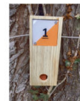
Balise à trouver