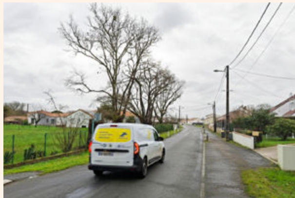
Rue de La Planche au Bouin

Une nouvelle phase de travaux s'engagera à l'automne 2026. Elle consistera à requalifier l'espace public. Pour sécuriser les piétons et favoriser l'accessibilité des